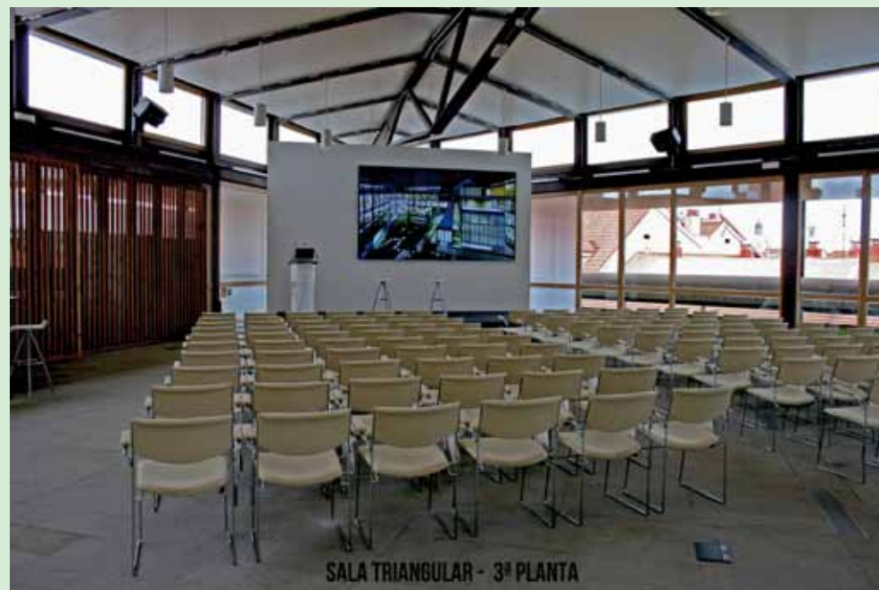
SALA TRIANGULAR - 3ª PLANTA