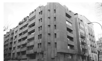
Edificio Caracas, 1966 Madrid