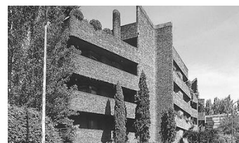
Edificio viviendas en c/ Menendez Pidal 41, 1970 Madrid