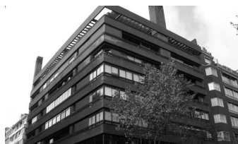
Edificio c/ Velazquez, 1964 Madrid