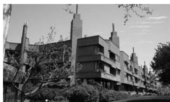
Grupo residencial "El Pardo de Aravaca" en Valdemarín, 1978 Madrid